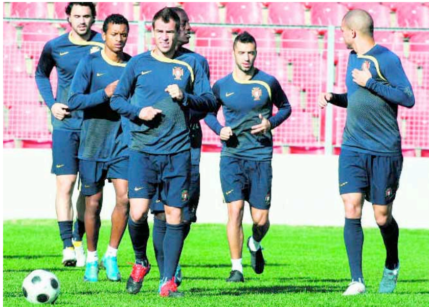
De Portugezen zijn nog lang niet zeker van deelname aan het WK. Zonder sterspeler Cristiano Ronaldo verdedigen ze vanavond in Zenica een magere 1-0 voorsprong tegen Bosnië.

De Russen incasseerden zaterdag twee minuten voor tijd een tegentreffer die de return in Slovenië opens meer dan een formaliteit maakte. Hiddink wil zijn strijdplan echter niet aanpassen aan de heikale omstandigheden.